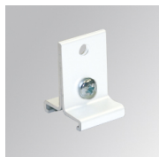
Cód. producto: TKASUSSUW

Descripción: TRACK ACC. SUSP SUPPORT BK.