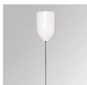
Cód. producto: TKAWI3000W

Descripción: TRACK ACC. STEEL CABLE 3M BK.