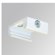
Cód. producto: TKASRSUW