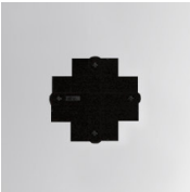
Cód. producto: TKACXB