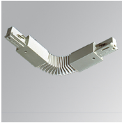
Cód. producto: TKAJFDB TKAJFDNG TKAJFDNW