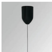
Cód. producto: TKAWI3000B

Descripción: TRACK ACC. SUSP SUPPORT WH.