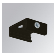
Cód. producto: TKASRSUB