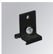
Cód. producto: TKASUSSUB

Descripción: TRACK ACC. RIGID SUSP 1M WH.