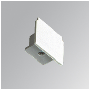
Cód. producto: TKAECB TKAECG TKAECW