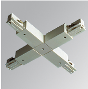
Cód. producto: TKAXJDNB TKAXJDNG TKAXJDNW