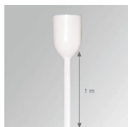
Cód. producto: TKARG1000W

Descripción: TRACK ACC. RIGID SUSP 1M WH.