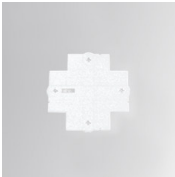
Cód. producto: TKACXW