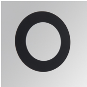
Cód. producto: CURD95B