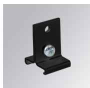
Cód. producto: TKASUSSUG

Descripción: TRACK ACC. SUSP SUPPORT GR.