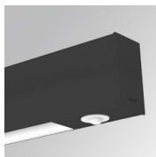
Cód. producto: F41EMG3HDWB

Descripción: ACC.FIL45 DOWNLIGHT EMERGENCIA 3H BK