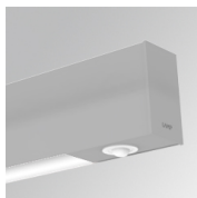
Cód. producto: F41EMG3HDWG

Descripción: ACC.FIL45 DOWNLIGHT EMERGENCIA 3H BK