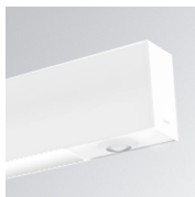
Cód. producto: F41LIGHTSNDW

Descripción: ACC.FIL45 SENSOR BASIC ILD DALI-2 GR