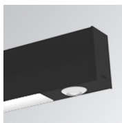
Cód. producto: F41LIGHTSNDB

Descripción: ACC.FIL45 DOWNLIGHT EMERGENCIA 3H WH