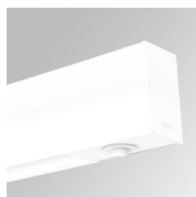
Cód. producto: F41EMG3HDWW

Descripción: ACC.FIL45 DOWNLIGHT EMERGENCIA 3H WH