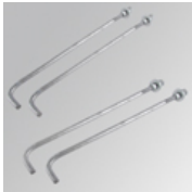
Cód. producto: MIBO12