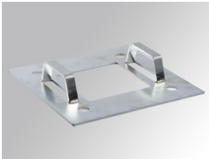
Cód. producto: MIFT220