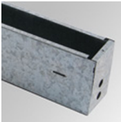
Cód. producto: BUREBO1272