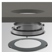
Cód. producto: 9300273 Descripción: GAP ACC. REC CEILING RING