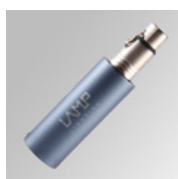
Cód. producto: 9640790 Descripción: ACC. DMX/RDM CHANNEL ADDRESSING USB