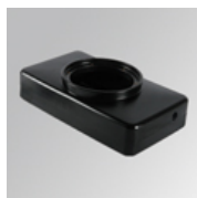
Cód. producto: 9300252 Descripción: GAP ACC. REC BOX