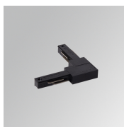
Cód. producto: TLSULIDB

Descripción: TRACK 48V ACC. INTM JOINT DALI WH.