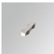
Cód. producto: TLSUIJDW

Descripción: TRACK 48V ACC. INTM JOINT DALI BK.