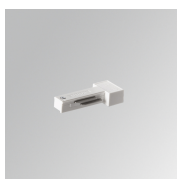
Cód. producto: TLSUARDW

Descripción: TRACK 48V ACC. RIGHT MAIN SUPPLY DALI BK