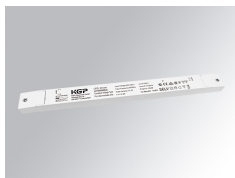
Cód. producto: TLDRV2015048N

Descripción: DRIVER 150W 48V 220-240V NR IND