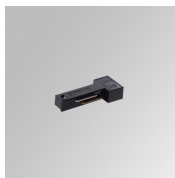
Cód. producto: TLSUALDB

Descripción: DRIVER 150W 48V 220-240V NR IND