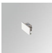
Cód. producto: TLSUECW

Descripción: TRACK 48V ACC. END COVER BK.