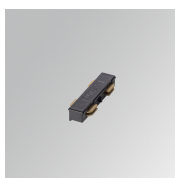
Cód. producto: TLSUIJDB

Descripción: TRACK 48V ACC. END COVER WH.