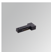
Cód. producto: TLSUARDB

Descripción: TRACK 48V ACC. LEFT MAIN SUPPLY DALI WH.