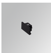
Cód. producto: TLSUECB

Descripción: TRACK 48V ACC. RIGHT MAIN SUPPLY DALI WH