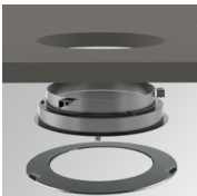
Cód. producto: GARERIRDM