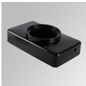
Cód. producto: GAREBOB