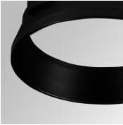
Cód. producto: HSRI65B