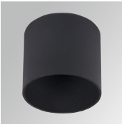
Cód. producto: HSCU50