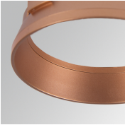
Cód. producto: HSRI65C