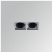
Cód. producto: ODRF2M