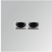
Cód. producto: ODRF2W