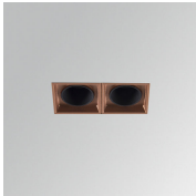
Cód. producto: ODRF2C