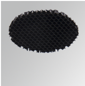
Cód. producto: HSHO50 Descripción: HANCE 1000/2000 ACC. HONEYCOMB GRILLE