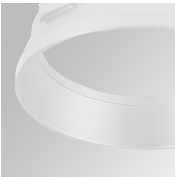
Cód. producto: HSRI65W Descripción: HANCE 1000/2000 ACC. RING DECO WH.