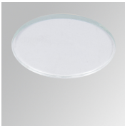
Cód. producto: HSTR50 Descripción: HANCE 1000/2000 ACC. DIF TRANS