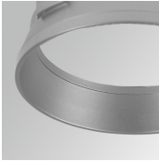
Cód. producto: HSRI65M Descripción: HANCE 1000/2000 ACC. RING DECO MET.