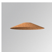
Cód. producto: S8BE363CK