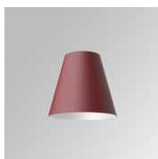
Cód. producto: S8BE161B1