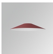
Cód. producto: S8BE363B1