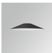
Cód. producto: S8BE363B