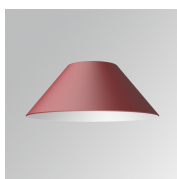
Cód. producto: S8BE227B1