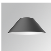
Cód. producto: S8BE227B