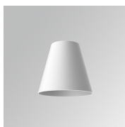
Cód. producto: S8BE161W