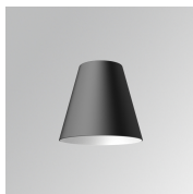
Cód. producto: S8BE161B