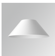
Cód. producto: S8BE227W