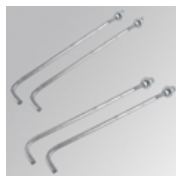
Code produit: SMSC22 Description: POLE ACC. M22 BOLT SET