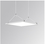
Cód. producto: PLSUW11500