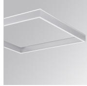
Cód. producto: PLSFFR060

Descripción: PLAT ACC. FRAME REC 600X600MM WH.