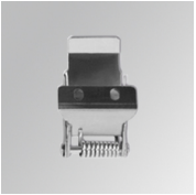
Cód. producto: PLXSFCL

Descripción: PLAT ACC. FRAME SUR 600X600MM WH.