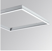
Cód. producto: PLREFR060

Descripción: PLAT ACC. FRAME REC 600X600MM WH.