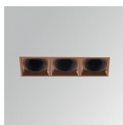
Cód. producto: ODRF3C Descripción: OCULT ACC. REFLECTOR 3 CO.