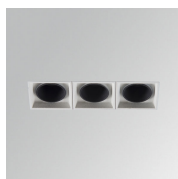
Cód. producto: ODRF3W Descripción: OCULT ACC. REFLECTOR 3 WH.