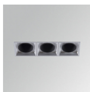
Cód. producto: ODRF3M Descripción: OCULT ACC. REFLECTOR 3 MT.