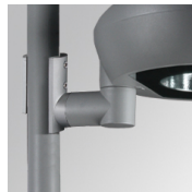
Cód. producto: NIPOBR135G

Descripción: NIU ACC. IND Ø60-135 POLE CLAMP