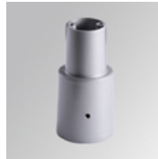
Cód. producto: NIPOAD76G