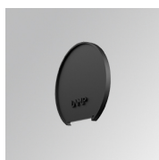
Cód. producto: L6SUECB