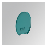
Cód. producto: L6SUECW3