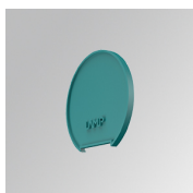
Cód. producto: L6SUECW3