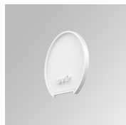
Cód. producto: L6SUECW