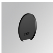
Cód. producto: L6SUECB