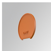
Cód. producto: L6SUECW4