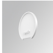
Cód. producto: L6SUECW