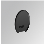
Cód. producto: L6SUECB