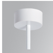
Cód. producto: K2SUCARG0500DW K2SUCARG0500NW K2SUCARG1000DW K2SUCARG1000NW