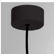
Cód. producto: K2SUCAWI2000DB K2SUCAWI2000NB