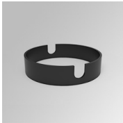
Cód. producto: K21SUADLATBK