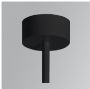
Cód. producto: K2SUCARG0500DB K2SUCARG0500NB K2SUCARG1000DB K2SUCARG1000NB