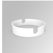
Cód. producto: K21SUADLATWH