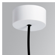
Cód. producto: K2SUCAWI2000DW K2SUCAWI2000NW