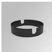
Code produit: K21SUADLATBK