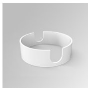
Code produit: K11SUADLATWH