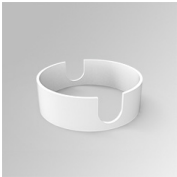
Cód. producto: K11SUADLATWH