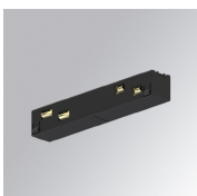
Cód. producto: TLASUIJDNB