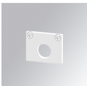
Cód. producto: TLASUECCW