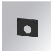
Cód. producto: TLASUECB