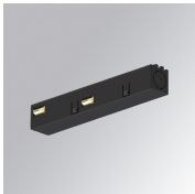
Cód. producto: TLASUADNB