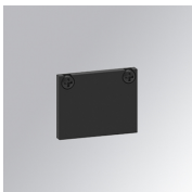
Cód. producto: TLASUECB