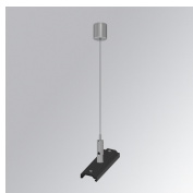
Cód. producto: TLASUWI1500B TLASUWI3000B TLASUWI1500B

Descripción: TRACK 48V ACC. 90° CORNER DALI/ONOFF WH.