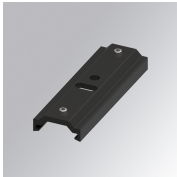
Cód. producto: TLAMJB