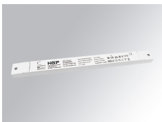
Cód. producto: TLDRV2010048N

Descripción: DRIVER 100W 48V 220-240V NR IND LIN