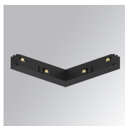
Cód. producto: TLASULDNB

Descripción: TRACK 48V ACC. 90° CORNER DALI/ONOFF BK.