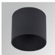
Cód. producto: HSCU50

Descripción: HANCE 1000/2000 ACC. CUTTING BEAM