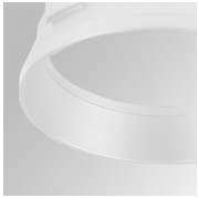
Cód. producto: HSRI65W

Descripción: HANCE 1000/2000 ACC. RING DECO MET.