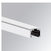
Cód. producto: TLSUPR1000DNW TLSUPR2000DNW

Descripción: TRACK 48V DALI/ONOFF 1M BK. TRACK 48V DALI/ONOFF 2M BK.