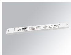
Cód. producto: TLDRV2015048N

Descripción: DRIVER 100W 48V 220-240V NR IND LIN