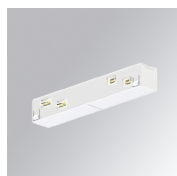
Cód. producto: TLASUIJDNW