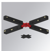
Cód. producto: TLASUXJDNB

Descripción: SUSPENSION CABLE TRACK 48V 1500MM WH SUSPENSION CABLE TRACK 48V 3000MM WH