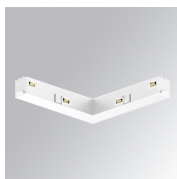
Cód. producto: TLASULDNW

Descripción: TRACK 48V ACC. 90° CORNER DALI/ONOFF BK.