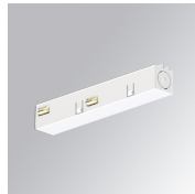
Cód. producto: TLASUADNW