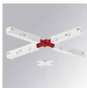
Cód. producto: TLASUXJDNW

Descripción: TRACK 48V ACC. X JOINT DALI/ONOFF BK.