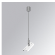
Cód. producto: TLASUWI1500W TLASUWI3000W

Descripción: SUSPENSION CABLE TRACK 48V 1500MM BK SUSPENSION CABLE TRACK 48V 3000MM BK Z7