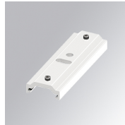
Cód. producto: TLAMJW