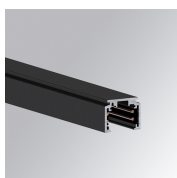
Cód. producto: TLSUPR1000DNB TLSUPR2000DNB

Descripción: TRACK 48V ACC. X JOINT DALI/ONOFF WH.