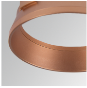
Cód. producto: HSRI65C

Descripción: HANCE 1000/2000 ACC. RING DECO CO.