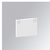
Cód. producto: TLASUECW