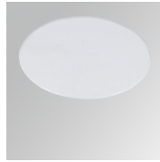
Cód. producto: HSSL50

Descripción: HANCE 1000/2000 ACC. RING DECO WH.