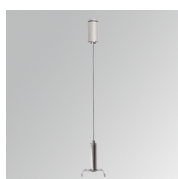
Code produit: F3SUWIDE1000G