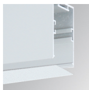
Code produit: F3COX/MMW