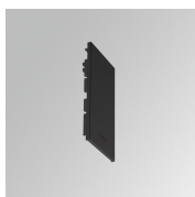
Code produit: F3SUECB