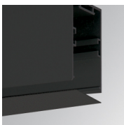
Cód. producto: F3PRSUX/MMB