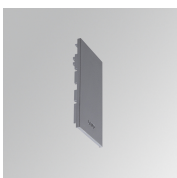
Cód. producto: F3SUECG