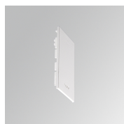
Cód. producto: F3SUECW