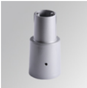
Cód. producto: NIPOAD76G