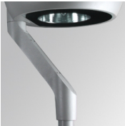
Cód. producto: NIARED60G