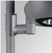
Cód. producto: NIPOBR135G