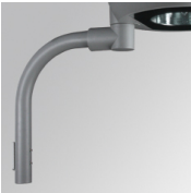
Cód. producto: NIAR650G