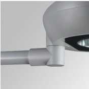
Cód. producto: NIPOBR48G NIPOBR60G