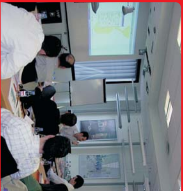
Curso en el Showroom LAMP Terrassa